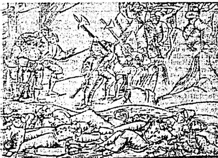
Lupta de la Zlatița — 1443 (După Bonfinius, Ed. Berne 1943)