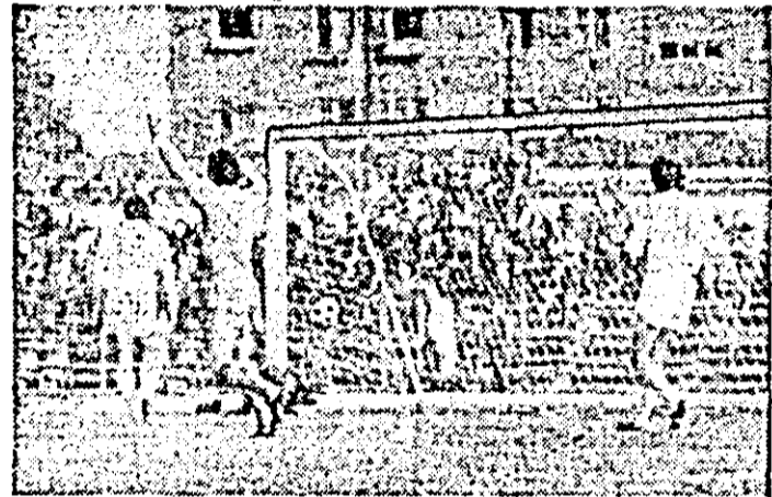
S-a înscris al doilea gol... (fără din meciul U.T.A. — C.I.L. Sighet 7-0).