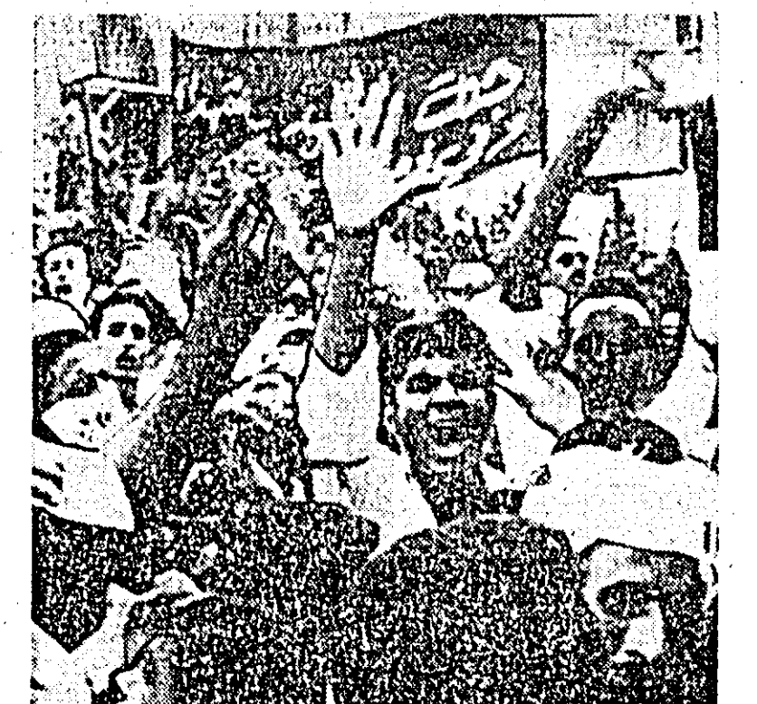
Aspect de la evenimentele din Aden: Demonstraţia de protest a locuitorilor, cu prilejul înmormîntării fiilor lui Mackawec.

PARIS 4 — Corespondentul Agerpres, Georges Dascal, transmite: La 5 martie, 28,5 milioane de alegători participă la primul tur al alegerilor pentru desemnarea a 486 deputaţi în noua Adunare Naţională Franceză.