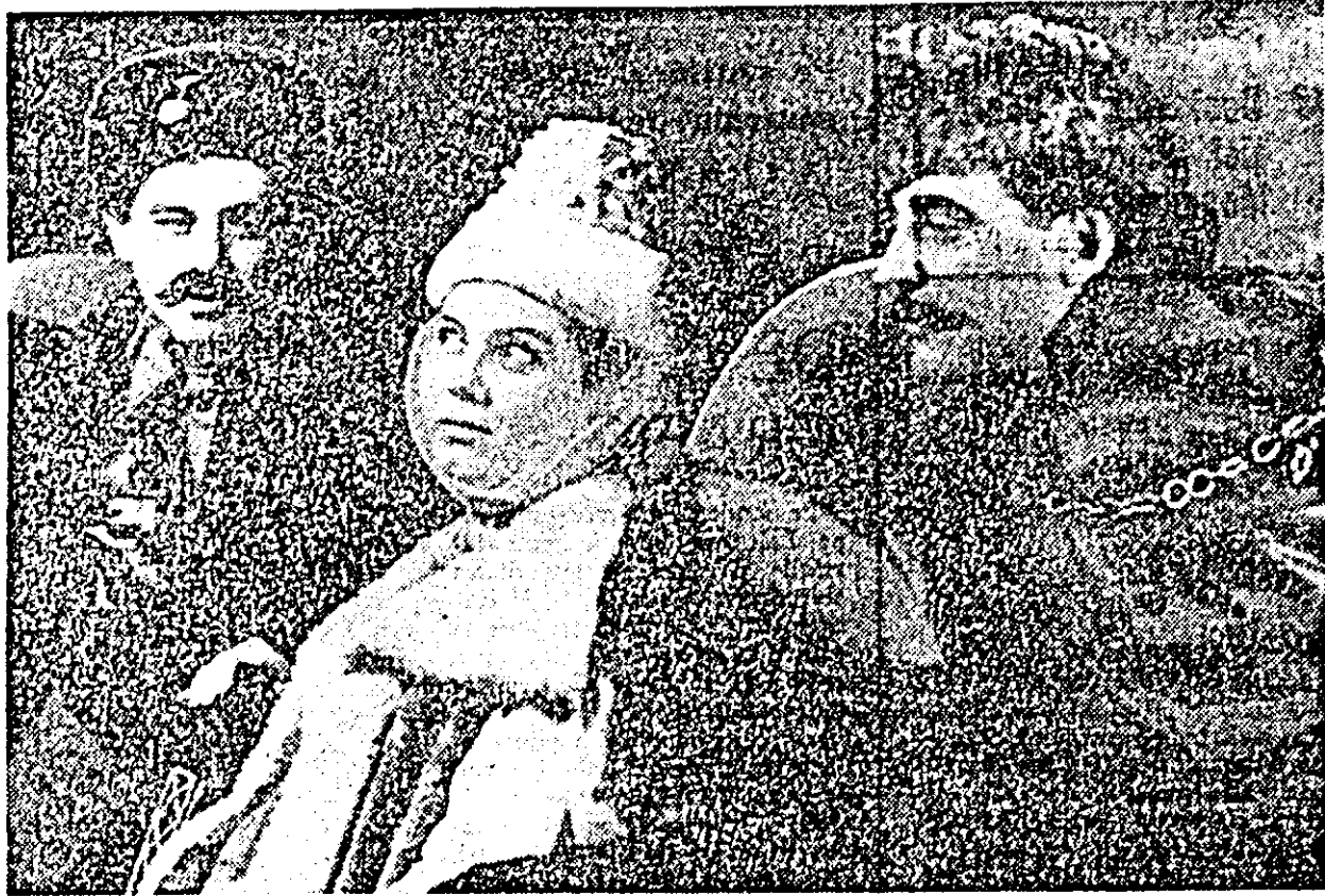
IN FOTOGRAFIE: un instantaneu din spectacolul „Rachierita”

Pe scena Teatrului de stat: „Rachierita” — dramă istorică în 5 acte — de Ion Luca