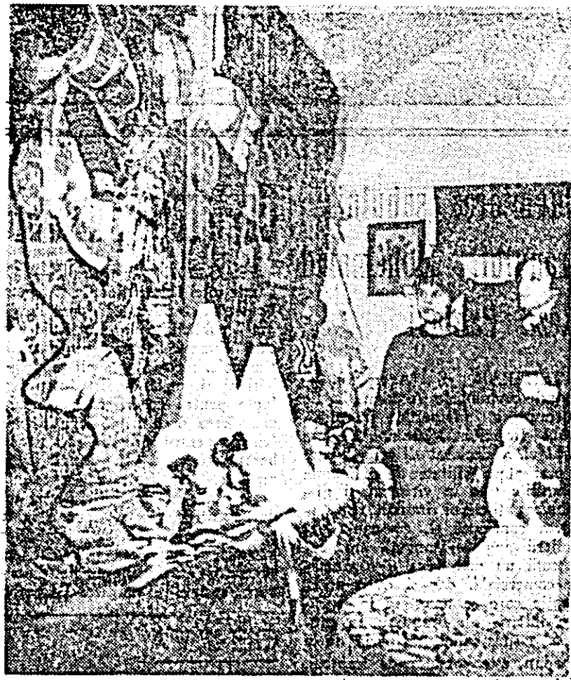
În cinstea zilei de 8 Martie Comitetul orașonească și raional al femeilor au amenajat două expoziții cu lucrul de mână...