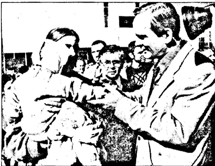
Theodor Stolojan ia în mâinile sale viitorul României

Toate discursurile s-au încheiat cu „vă rog să aveți încredere în noi.“