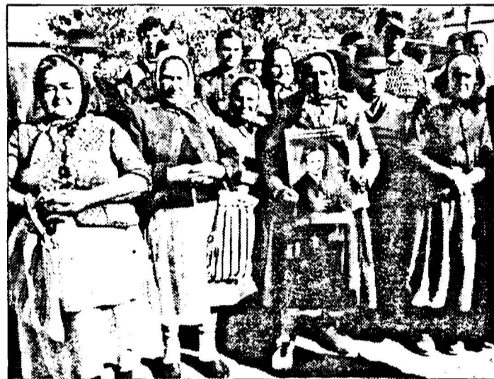
Maximă atenție la ceea ce spune Stolojan