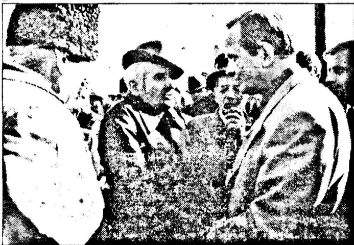
Să știi să asculți oamenii

Care au fost reacțiile celor ce l-au ascultat pe Theodor Stolojan?