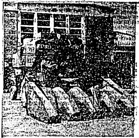
La S.M.A. Pecica mecanizatorii se pregătesc pentru campania de toamnă. În clișeu: se atașază dispozitivul pentru recoltatul culturilor țtrzii.