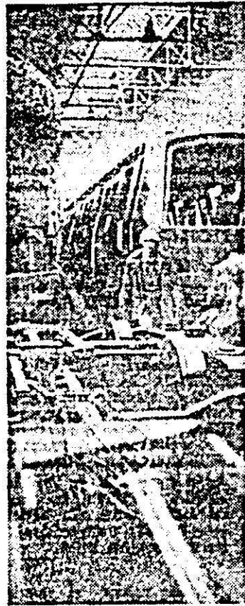
I.V.A. Aspect de muncă în secția montaj-sudură.