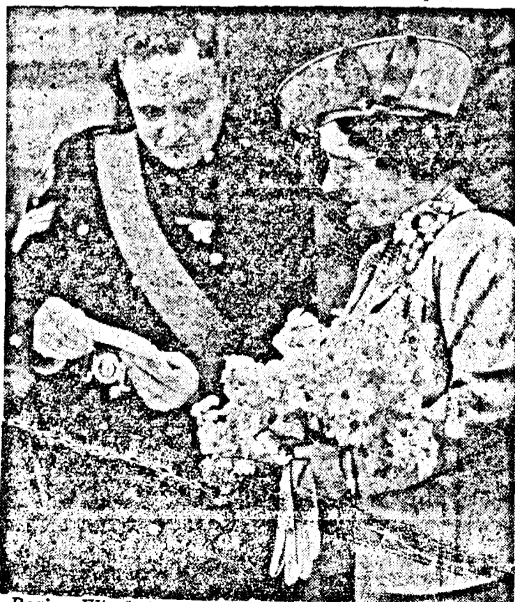
Regina Elisabeta a Angliei vizitează un spital cu răniți