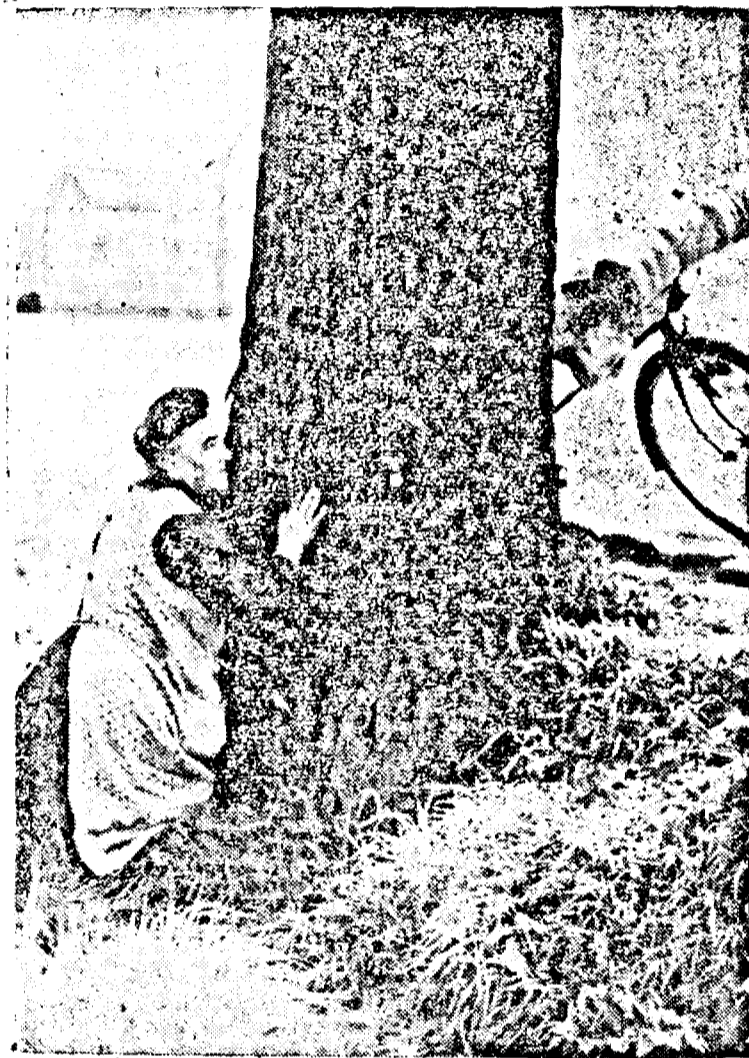
O gospodină surprinsă pe câmp de avioanele dușma- ne se refugiază disperată sub un arbore