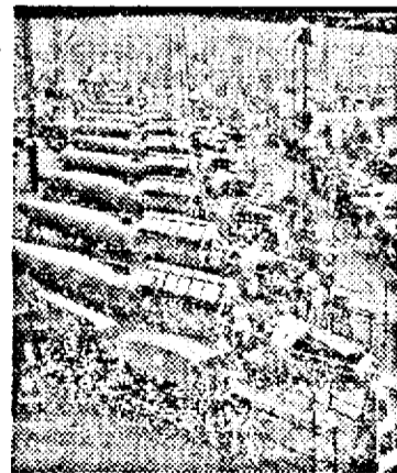
O fabrică de avioane engleză