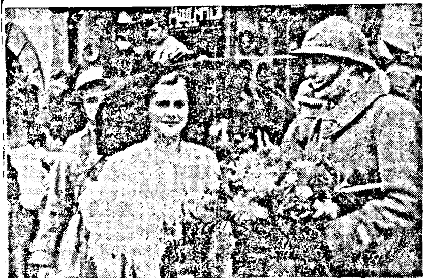
O alsaciană oferă flori vânătorilor francezi

IMEDIAT, IAR DUPĂ CE TRECUSI PODUL, PASAGERII AU FOST INTEROGAȚI DE POLIȚIȘTI CARE SUPRAVEGHIAZA PODUL, ÎMPREUNĂ CU UN DETAȘAMENT DE SOLDAȚI NICI PODUL, NICI LINIA FERATĂ NU AU SUFERIT VREO STRICĂCIUNE.