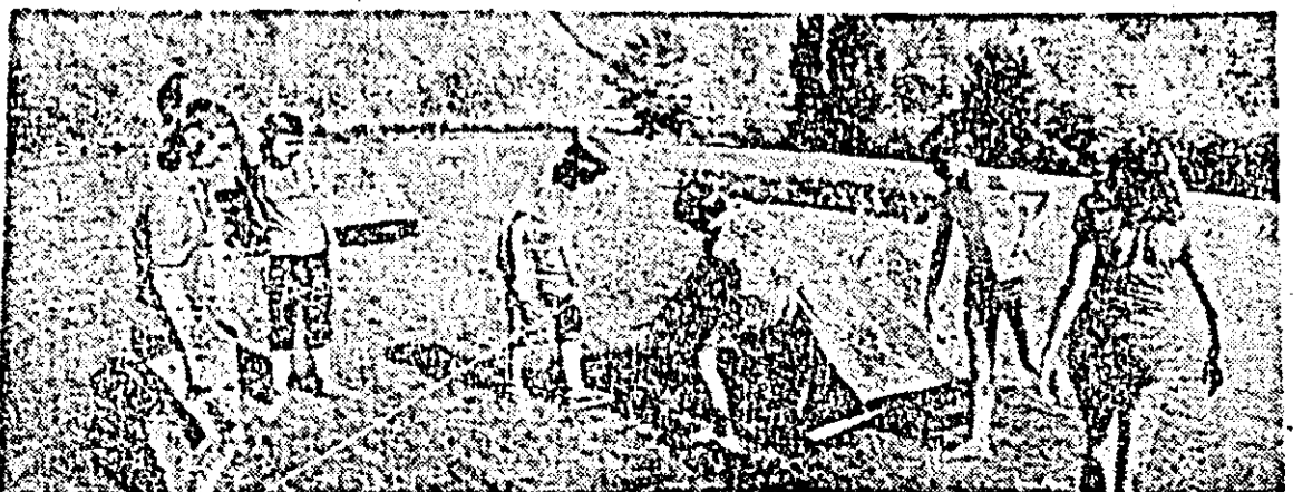
Pregătiri pentru tabăra pionierească.