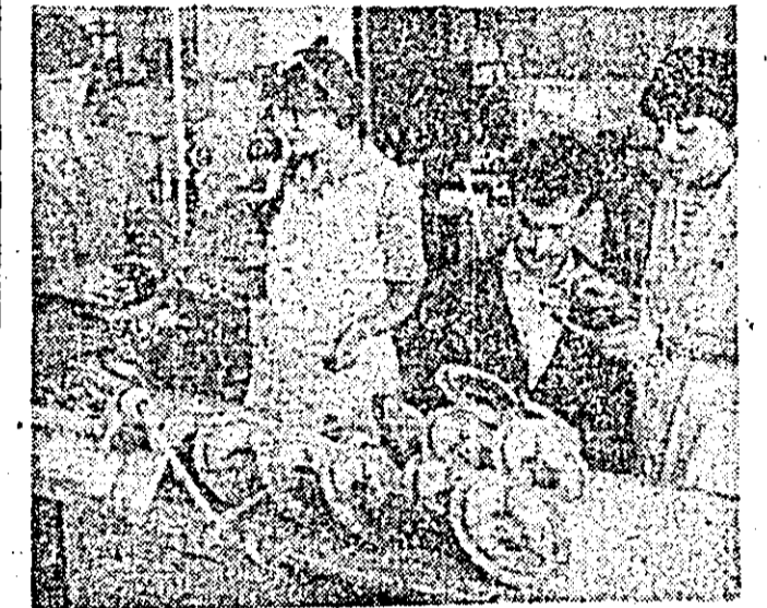
La întreprinderea de orologerie, colectivul de lăcătuși și montatori din atelierul prototipuri se evidențiază prin calitatea deosebită a lucrărilor executate.