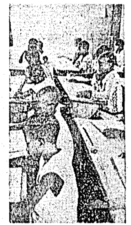
Școală în Kinshasa, capitala Congoului. Elevii învață cu seto, însușindu-și cunoștințele necesare pentru a putea pași spre un viitor civilizată.

Adunarea Generală a hotărât atunci ca lucrările sesiunii să fie reluate după ce consultările de răgoare vor dovedi că sînt îndeplinite condițiile pentru examinarea unuia din punctele menționate.