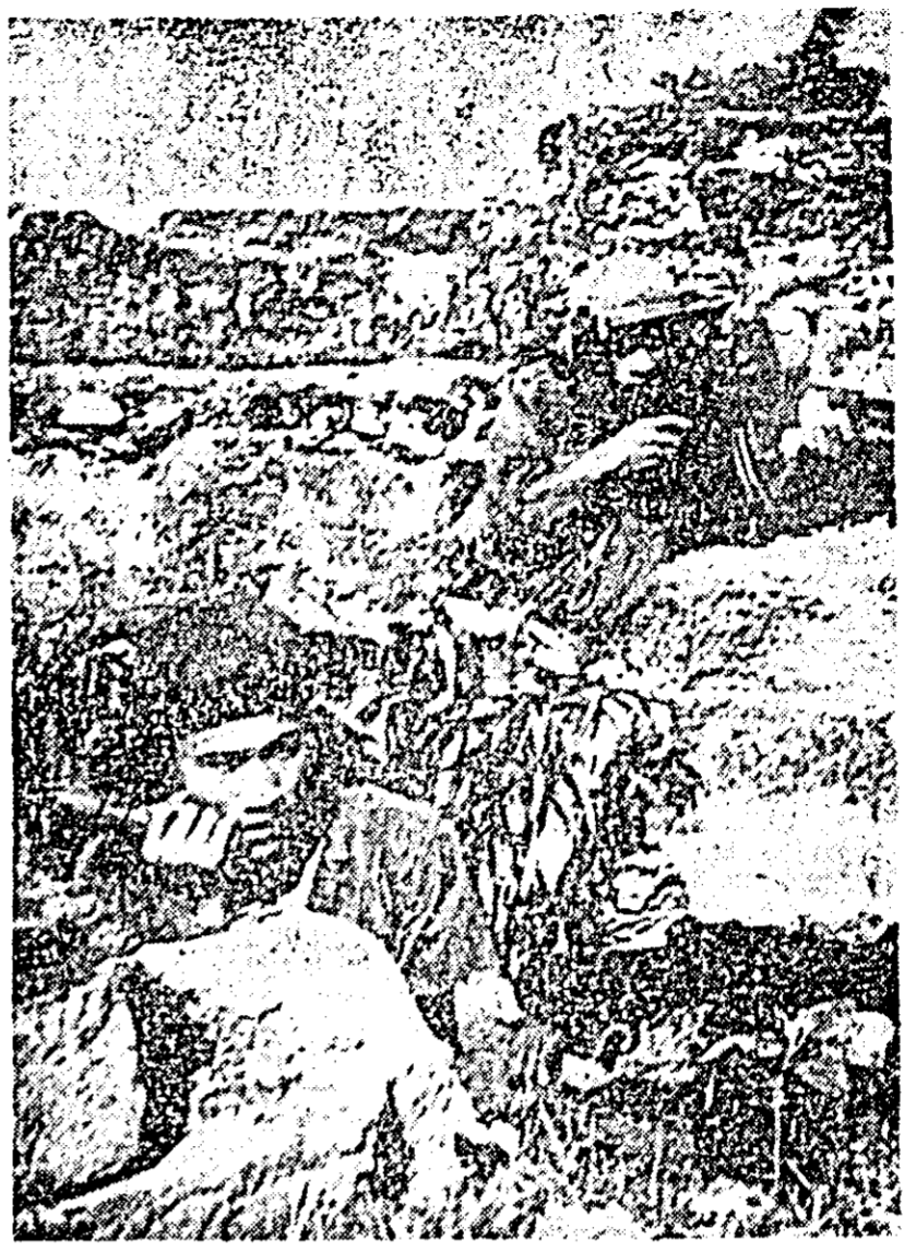
VIETNAMUL DE SUD. Luptători aparţinînd forţelor patriotice respingînd un atac inamic la nord de Quang Tri.

Unităţile Guvernului Revoluţionar Provizoriu al Republicii Vietnamului de sud au supus unor bombardamente cu rachete şi mortiere un număr de 16 obiective americano-saigoneze, provocînd pierderi inamicului. Printre poziţiile care au avut de suferit se numără baza de puşcaşi marini de la Quang Tri, situată la nord de Da Nang, şi tabăra saigoneză Dien Ban din regiunea de delţii.