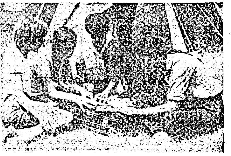
Turismul — una dintre cele mai îndrăgite activități pionieresti.

La CAP „Șiriana” s-au mai efectuat desigur și alte lucrări agricole de sezon. Hărnicia cooperativilor din această unitate este oglindită în felul cum se prezintă culturile în câmp, în modul cum s-au făcut toate pregătirile pentru începerea timp și desfășurarea în cele mai bune condiții întregului complex de lucrări din campania de vară.