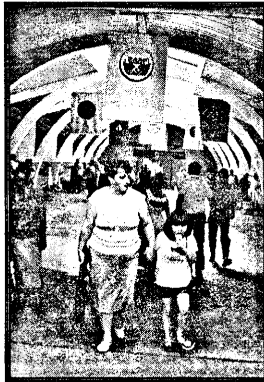
— Mami, multe s-au mai schimbat pe-aici, de când am fost ultima dată!