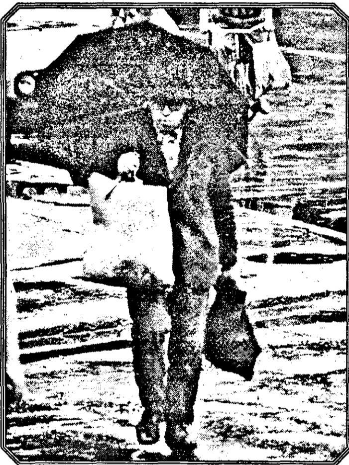
Ce mai poartă arădeanul: sacose cu umbrela.

Anotimpul picioarelor dezvelite și...obsesia varicelor (Cititi în pagina 12-a, „Femina”)