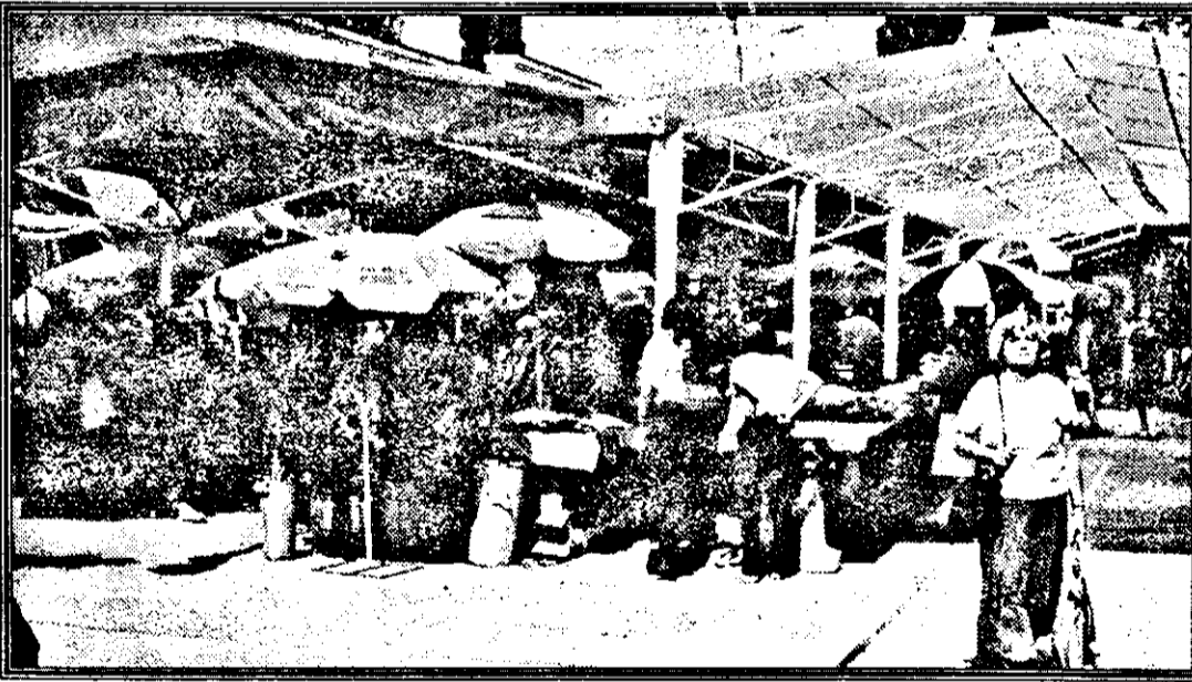
Foarte puține orașe se pot lăuda cu o piață de flori ca a Aradului...