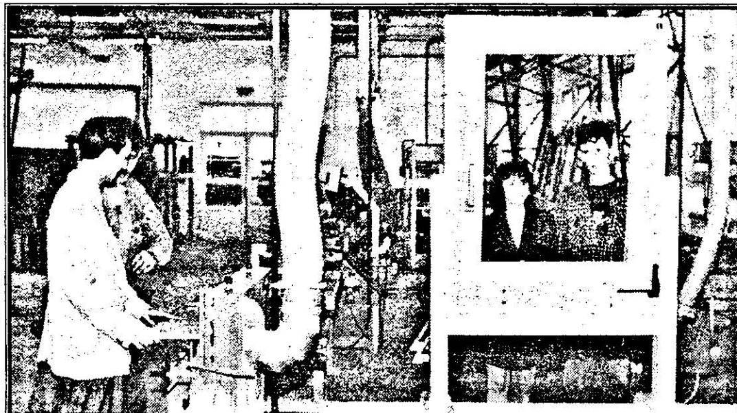
Privind spre viitor, printr-o fereastră meșterită chiar de proaspeții absolvenți.