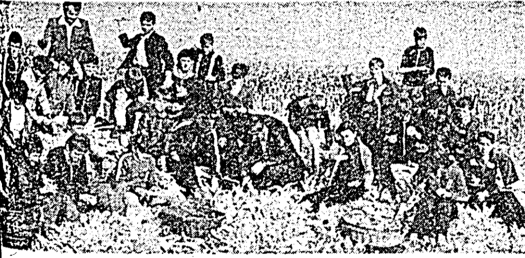
Detii arădeni acționează pentru adunarea și punerea la adăpost a roadelor acestel toamne.