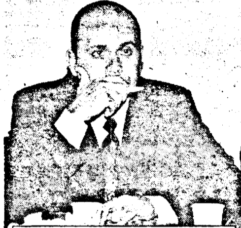
S-a ferit să spună prea multe

• dialog cu Cozmin Gușă, secretar general al PSD