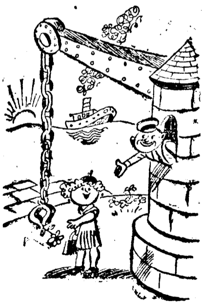
avagy tavasz a rakparton.