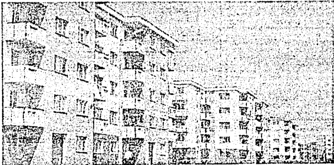
Micălaca. Noi și noi blocuri de locuințe îmbogățesc „zestrea” edilitară a cartieru-lui.