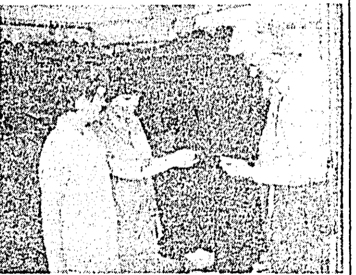
Întreprinderea de confecții. Calitatea noulor produse este verificată cu toată atenția.

Și la Întreprinderea textilă UTA din Arad se acțiunează susținut în direcția realizării și introducerii în producția de serie a unei game cît mai largi și diverse de noi țesături. Ca urmare a preocupărilor existente în acest sens, în primele nouă luni ale acestui an, au fost introduse în producție 13 noi articole de țesături. În 313 desene și 1.983 poziții coloristice, față de 212 desene și 1.271 poziții coloristice, cît a fost planificat. Prin aceasta, produsele noi și modernizate dețin, în perioada la care ne referim, o pondere de 75,5 la sută în totalul producției.