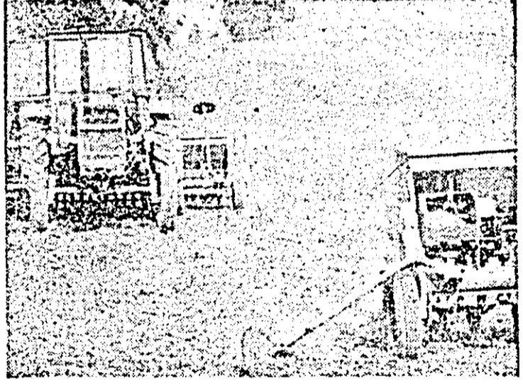
În unitățile din C.U.A.S.C. Vinga semănatul grîului se desfășoară cu intensitate.