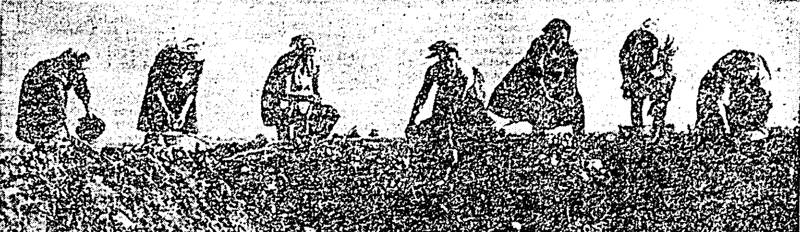
La cooperativa agricolă din Sîntana se recoltează cartofii de pe ultimele hectare.