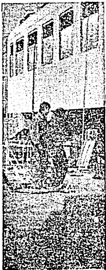
Întreprinderea de vagoane. Secvență de muncă în secția montaj-sudură.