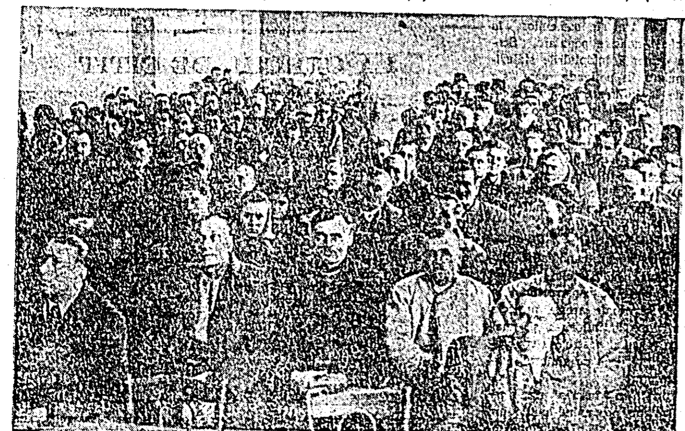
Participanții la consfătuire ascultă cu atenție referatele pe care le expun Inginerii agronomi. ÎN CLȘEU: un aspect din sala consfătuirii.

Îngropat boabele la întretăierea liniilor lăsate de marcazor. Pe această suprafață am făcut 3 prașile cu prașitoarele trase de cai și cu sapa în jurul plantelor. Cînd știuleții au făcut boabe, am observat că prea năvălesc ciorile la porumbul nostru și l-am păzît, cu doar nu era să lăsăm o așa mîndrețe de porumb să-l distrugă ciorile. Toamna, la recoltă, am cules de pe fiecare hectar însămînțat în cuiburi așezate în pătrat cîte 3.500 kg. porumb-boabe. Anul ăsta vom însămînța mai mult porumb în cuiburi așezate în pătrat și îndemnăm și pe alții colectiviști și întovărășii să însămînțeze după această metodă, avînd siguranța că vor culege recolte mari cu muncă mai puțină.