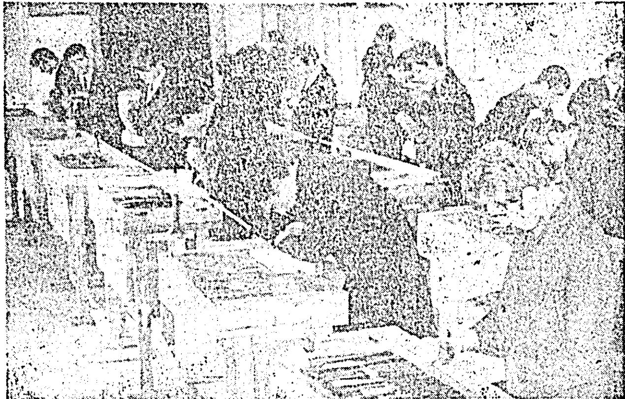
Ateliera școlii profesionale Industria Iernului. Sub îndrumarea atenției a maistrilor, elevii își însușesc talentele meșteșugului.