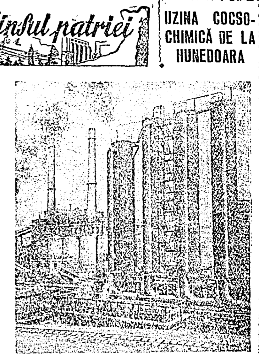
UZINA COCSO-CHIMICĂ DE LA HUNEDOARA

De la 23 August 1944 — ziua eliberării patriei noastre de sub jugul fascist — pînă la 1 Mai 1959, s-au construit și s-au dat în folosință pentru muncitorii, inginerii și funcționarii din sectorul industriei de petrol și chimie 6.327 apartamente, totalizînd o suprafață locuibilă de 305.071 m.p., 33.297 locuri în cîmine și dormitoare comune cu o suprafață de 171.316 m.p., 167 spitale, policlinici, dispensare, puncte sanitare și sanatorii de noapte cu un număr