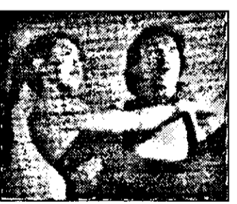
PRO 7: 0,05 City Hunter - f. acț. Hong Kong cu Jackie Chan

6,40 Viata satului 7,00 Magazin matinal 10,00 La ora 10 - magazin 10,10 Aventurile lui Skippy - s. Australia: Incendiul 10,35-13,00 Ora zece - mag. 11,50 Stiri 12,05 Desene animate 12,10 Descoperirile vietii - s. fr.