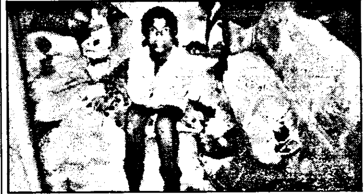
„Bunkerul” familial, plin de zdrențe prin care mișună gândaci. Familie sunt moi (nu contează că umblă gândaci și șobolani printre ele). O pungă de făină este răsturnată pe gura canalului, iar un câine micuț se încurcă printre