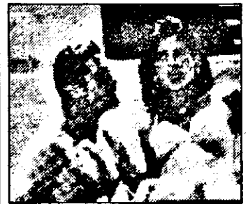
SAT 1: 19,00 Baywatch noaptea - s. am.: Săracul gigolo!

7,00 Bulevardul clipurilor - emis. muzicală 9,05 Mamele - s. 9,30 Tata fentează - s. 9,55 Se întorc băieții - s. 10,25 Roseanne - s. 10,45 Brisco County - s. 11,35 Puternica dragoste - f. Tv SUA 15,30 Furia de a iubi - dramă Canada 17,30 Sfântul - s. 18,20 O crimă neobișnuită - f. Anglia