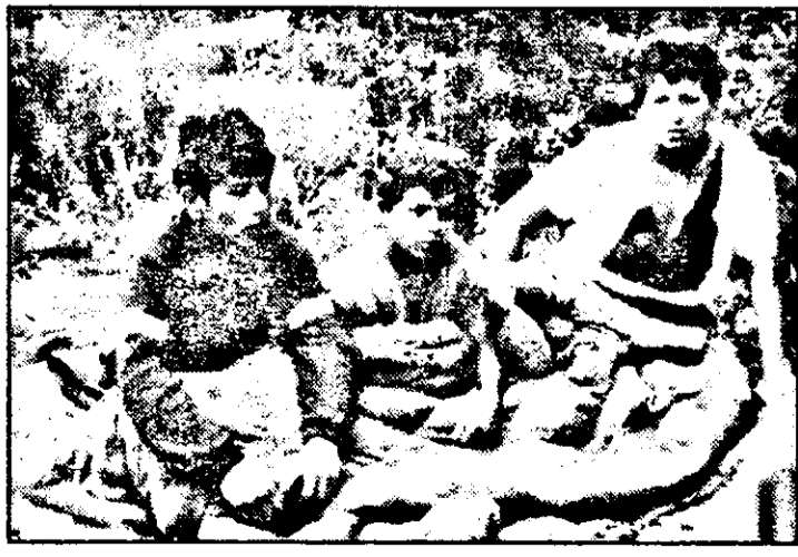
Puradeii și mama acestora se trezesc, injurând de ciudă că au fost deranjați din somn.