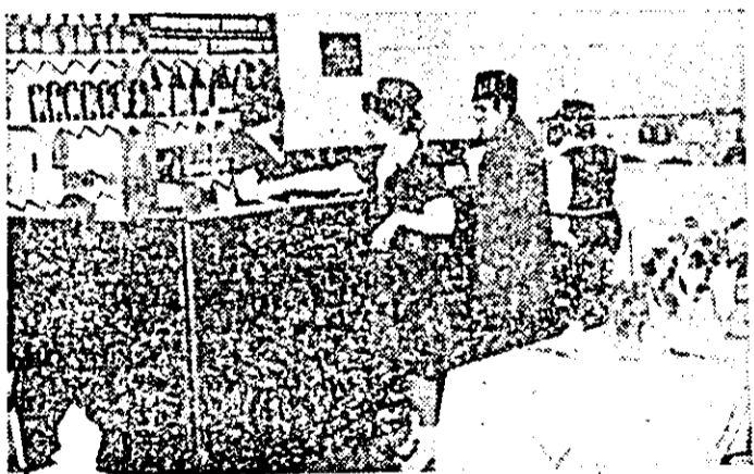
Recent redeschis după renovare, restaurantul „Miorița” al I.C.S.A.P. oferă condiții propice pentru o servire de calitate din toate punctele de vedere.

O dezbateri sinceră, tovarășească, pătrunsă de responsabilitate, de griji pentru viața și munca celor ce în rețeaua comercială și meșteșugărească au ca sarcină buna deservire a populației, îndeplinirea programului partidului de creștere neîntreruptă a nivelului de trai al oamenilor muncii.