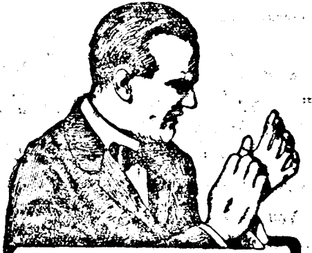
Soba ne vakarja bőrét, a CADUM-KENŐCS rögtön enyhítést hoz