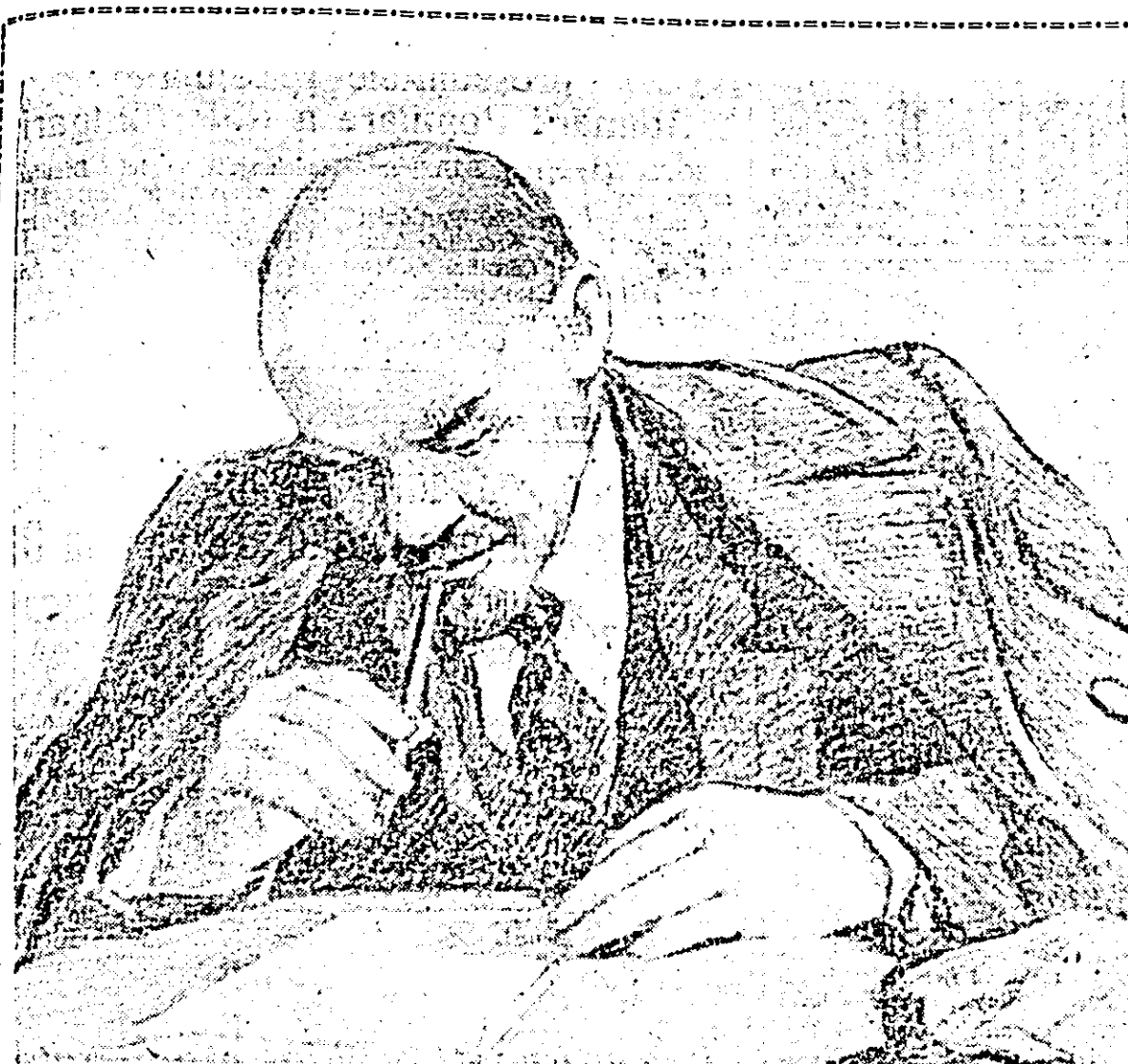
V. I. Lenin la masa de lucru.