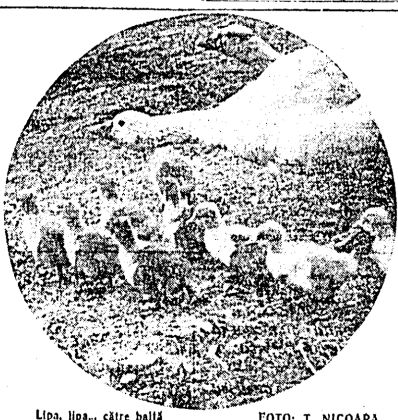
Lipa, lipa... către ballă