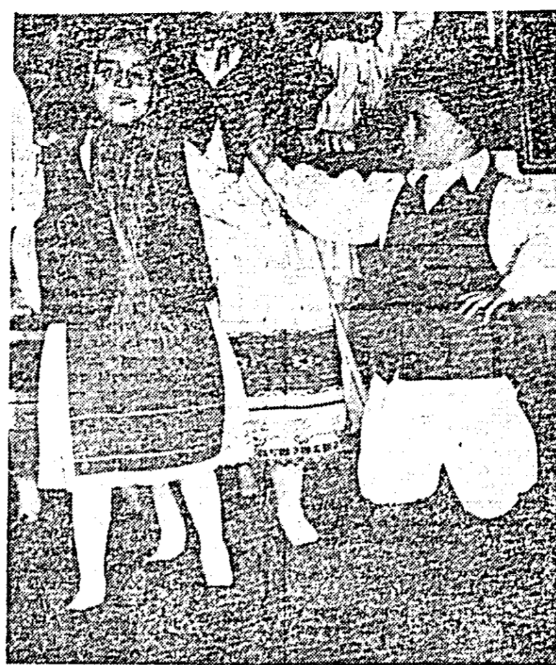
Cel mai tineri dansatori din Seceani.