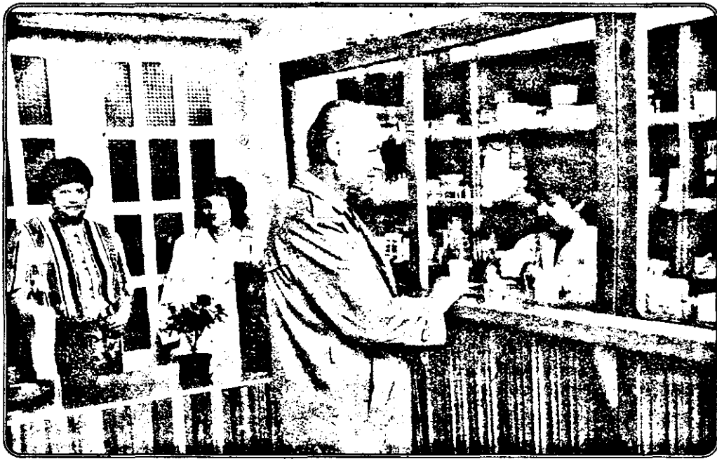
Complexul de magazine „Noul Stil”, recent, i s-a alăturat și o farmacie privată.