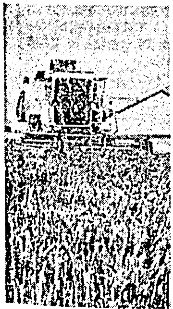
Și în unitățile din consiliul agroindustrial Șicla se depun eforturi sporite pentru urgentarea încheierii secerișului.

În consiliul unic agroindustrial Curtici, unde se află unul din cele mai puternice bazine legumicole din județ, recoltatul și valorificarea legumelor se desfășoară intens. La C.L.F., din cantitatea planificată de 7800 tone roșii au fost preluate și livrate către beneficiari 6000 tone. După cum am fost informați, cu toate greutățile cauzate de capriciile vremii, acțiunea se desfășoară mult mai bine ca în alți ani, în unitățile cooperatiste care predau aici roșiile manifestîndu-se interesul pentru stringerea la timp a roșiilor cît și pentru livrarea lor într-o perioadă cît mai scurtă. C.A.P. „23 August” din Curtici, bunăoară, dintr-un plan anual de 1700 tone roșii timpurii la fondul de stat a produs peste 1200