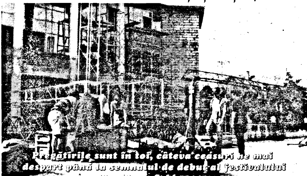
Pregătirile sunt în toi, câteva ceasuri de mai despart până la semnul de debut al festivalului Pop-Rock Sebiș 2000