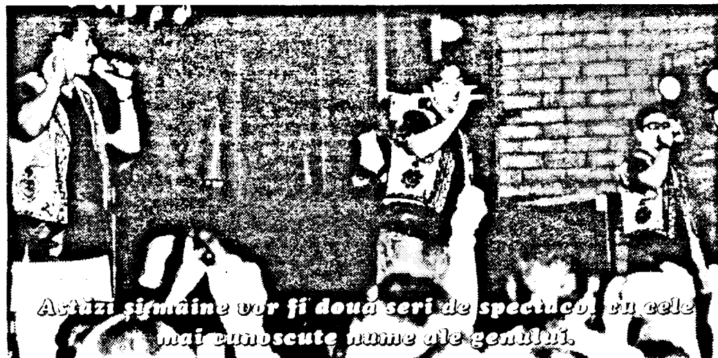
Astăzi și mâine vor fi două seri de spectacol în cele mai cunoscute nume ale genului.