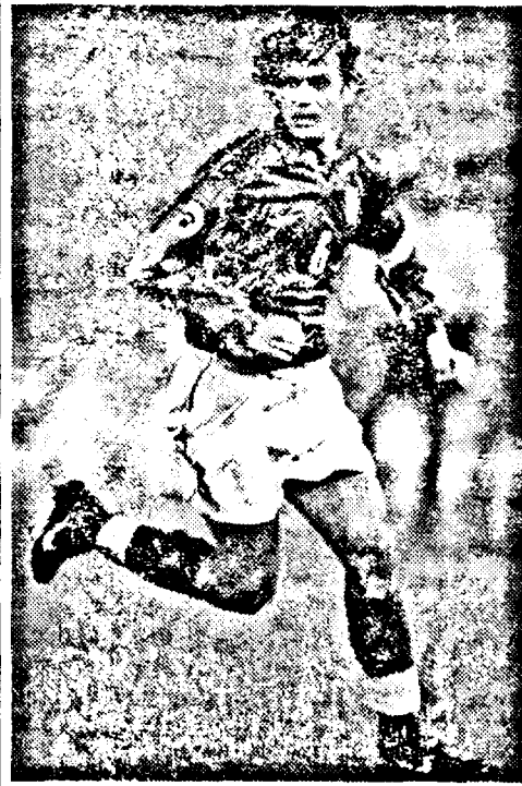
Capitanul „squadrei azzurra” Paolo Maldini.