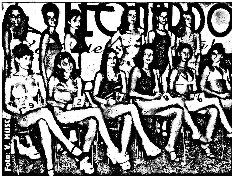
Cele 12 candidate la titlul de Miss Vest 2000, la proba „costume de baie”

Madonna a continuat să-și dezvăluie secretele și a spus că a ales cu bună știință o rochie neagră pentru premieră, pentru că negrul este singura culoare care slăbește. "Orice altceva aș purta, arată ca o canapea", a glumit ea. Tatăl viitorului copil al Madonnei, regizorul britanic Guy Ritchie, ("Lock, Stock and Two Smoking Barrels"), a fost arestat sâmbăina trecută pentru a lovi un fan al artistei care o urmărea pe aceasta de câteva săptămîni și care o aștepta în fața casei lor din Londra. El a fost eliberat pe cauțiune.