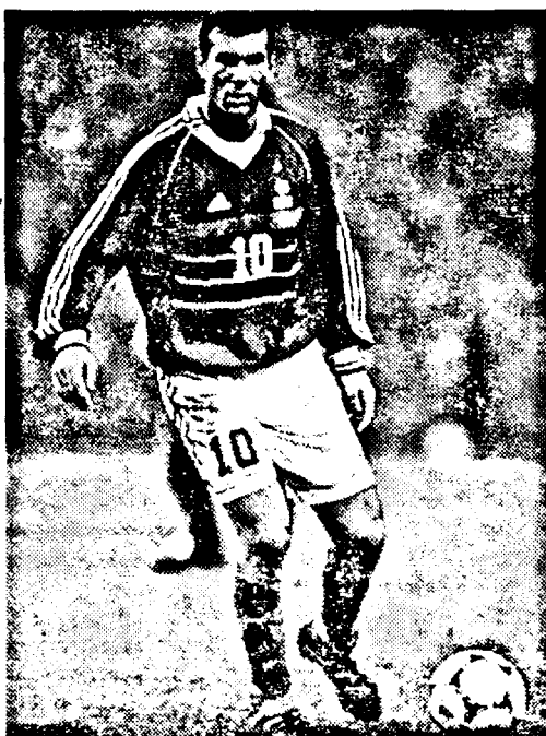
Zinedine Zidane este liderul echipei campioană mondială.

Măine, pe stadionul Jan Breydel din Bruges va avea loc primul meci din grupa D, între reprezentativele Franței și Danemarcei.