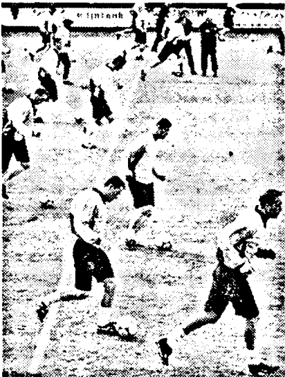
Fotbaliștii belgieni pregătesc în liniște duelul cu suedezi.

Dincolo, antrenorul nordicilor, Tommy Soderberg a zis că primul meci este cel mai