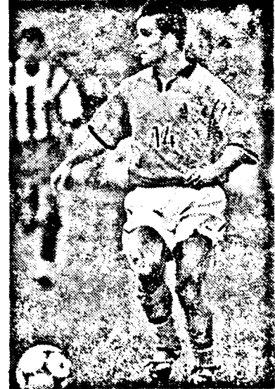
Overmars este capabil să decidă soarta meciului.