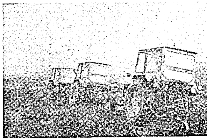
Mecanizatorii de la S.M.A. Gurahonț execută destelenirea pășunilor în satul Mermestii, comuna Vîrfurile.