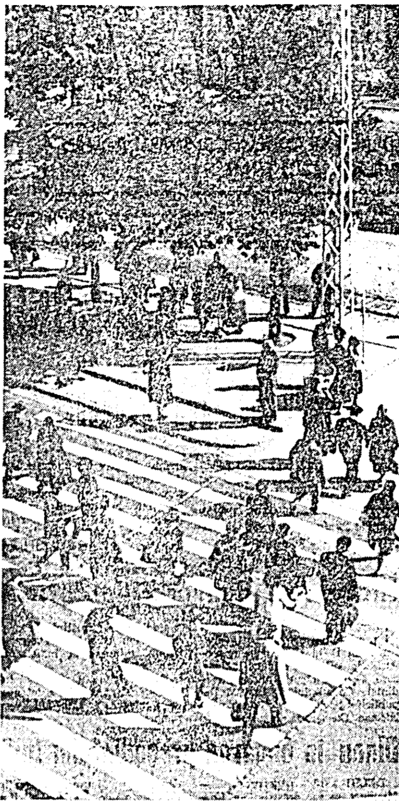
Oră de virf.