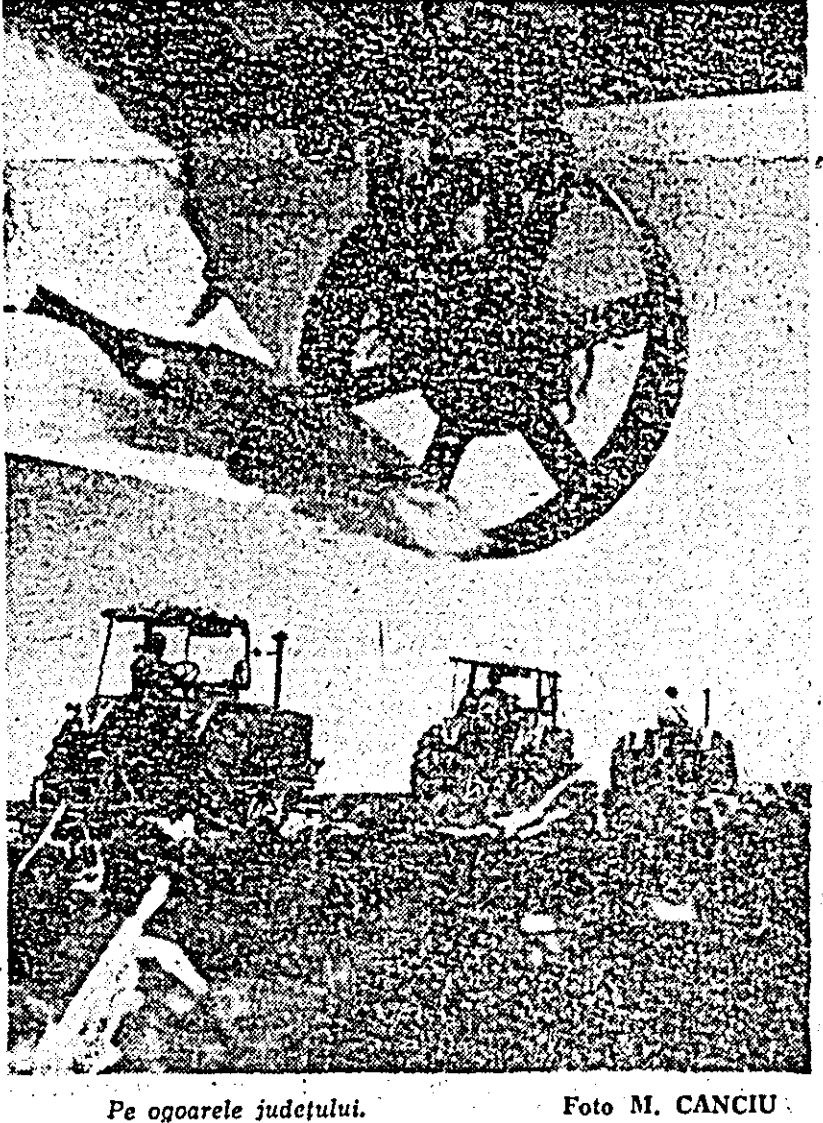
Pe ogoarele județului.

Ar fi greșit să se tragă concluzia că în această perioadă în unitățile agricole avem de-a face cu o activitate mai puțin aglomerată. Din contră, pe lângă faptul că se cer efectuate o serie de lucrări ce nu pot fi realizate mecanicizării, cooperativii au de pus bazele recoltelor anului viitor. Pe alocuri mai există, e drept în mică proporție, cereale și în de ulei netrelerate. Îndecesebi în zona de deal, unde eforturile trebuie întinse în vederea terminării urgente a treierii. Astfel de lucrări se cer încheiate la Dezna, Bontestii, Revetiș și în alte localități. Semnalăm apoi și faptul că în cooperativile agricole din Agrișul Mic, Bocsig, Chișlaca, Draut, Hășmaș, Bata, Lălașinț, etc. arăturile n-au fost încă efectuate în întregime, ceea