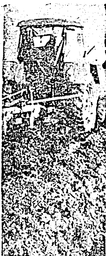
Arăturile în vederea însămînțărilor de toamnă — o lucrare ce nu suferă întîrziere.