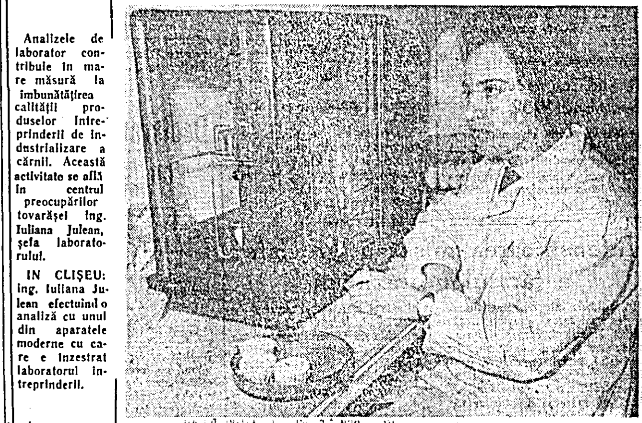
Analizele de laborator contribuie în mare măsură la îmbunătățirea calității produselor întreprinderii.

Duminică, 13 ianuarie, orele 16: „Fips și ursul la circ”.