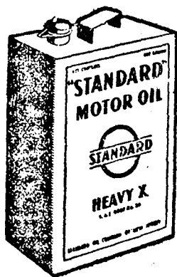
Minden kőnna Standard Motor Oilt Amerikában töltenek és pecsételik le.

BÜSZKÉK , vagyunk, hogy ezen világhírű automobil karavánja számára a Standard gyártmányokat választották. Az Ön autójának egészen bizonyosan nem kell olyan nehézségekkel megküzdenie, mint amelyekkel az e karavánban résztvevő automobilonak ta-