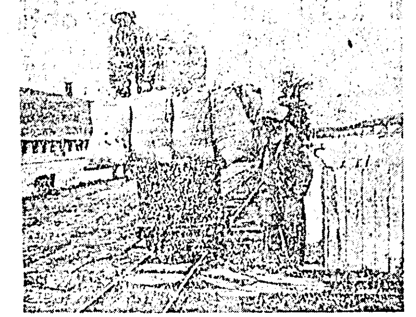
De la magazine furajele sint transportate pe linii decolii.

Prezentarea cetățenilor este obligatorie pentru declararea terenurilor ce posedă (grădini în jurul casei, terenuri virane, terenuri arabile) animale (cal, vacă, bol, oi, capre, porci) și stupi de albine. La prezentare fiecare cetățean trebuie să cunoască suprafețele de terenuri ce posedă în ha și pe țeturi de cultură, precum și specia animalelor cu vîrsta fiecăruia. So dau declarații scrise pe imprimărie oficială care se găsesc la secțiunea agricolă respectivă.