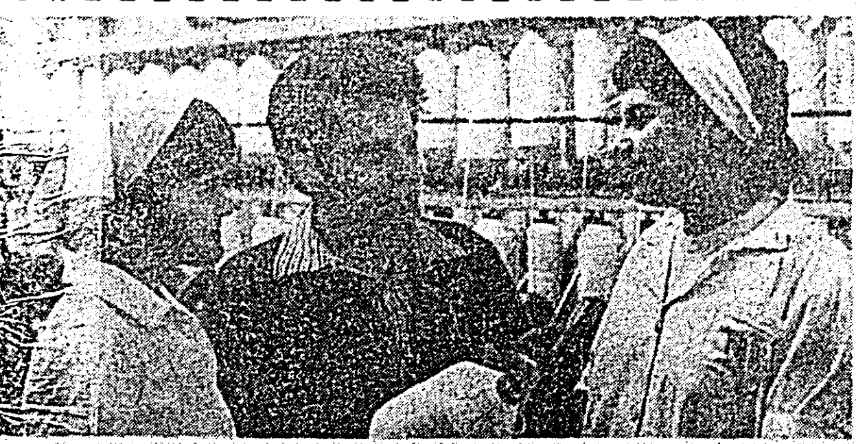
Șieve ale Liceului nr. 3 în orele de practică în secția filtrării a uzinelor „30 Decembrie”.