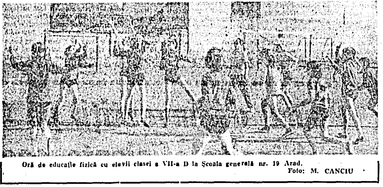
Ora de educație fizică cu elevii clasei a VII-a D la Școala generală nr. 19 Arad.

JOI, 2 martie 9.00 Telex. 9.05 Ritm, tinerete, dans. 9.50 Desene animate. 10.00 Curs de limba engleză. 10.30 Televiziunea: Corabia nebunilor. 12.55 Telegen. 15.30 Lecții TV pentru lucrătorii din agricultură. 16.30—17.00 Curs de limba germană. 17.35 Emisiune în limba maghiară. 18.35 Confruntări. 19.00 Muzică ușoară românească. 19.20—10.01 de seri. 19.30 Telegen. 20.00 Reflector. 20.10 Handbal masculin România-Cehoslovacia (repriza a II-a). 20.40 Tineri despre ei înșiși. 21.00 Pagina de umor: Antologie Charlie Chaplin. 21.40 Măi aveți o întrebare? 22.30 84 de ore.