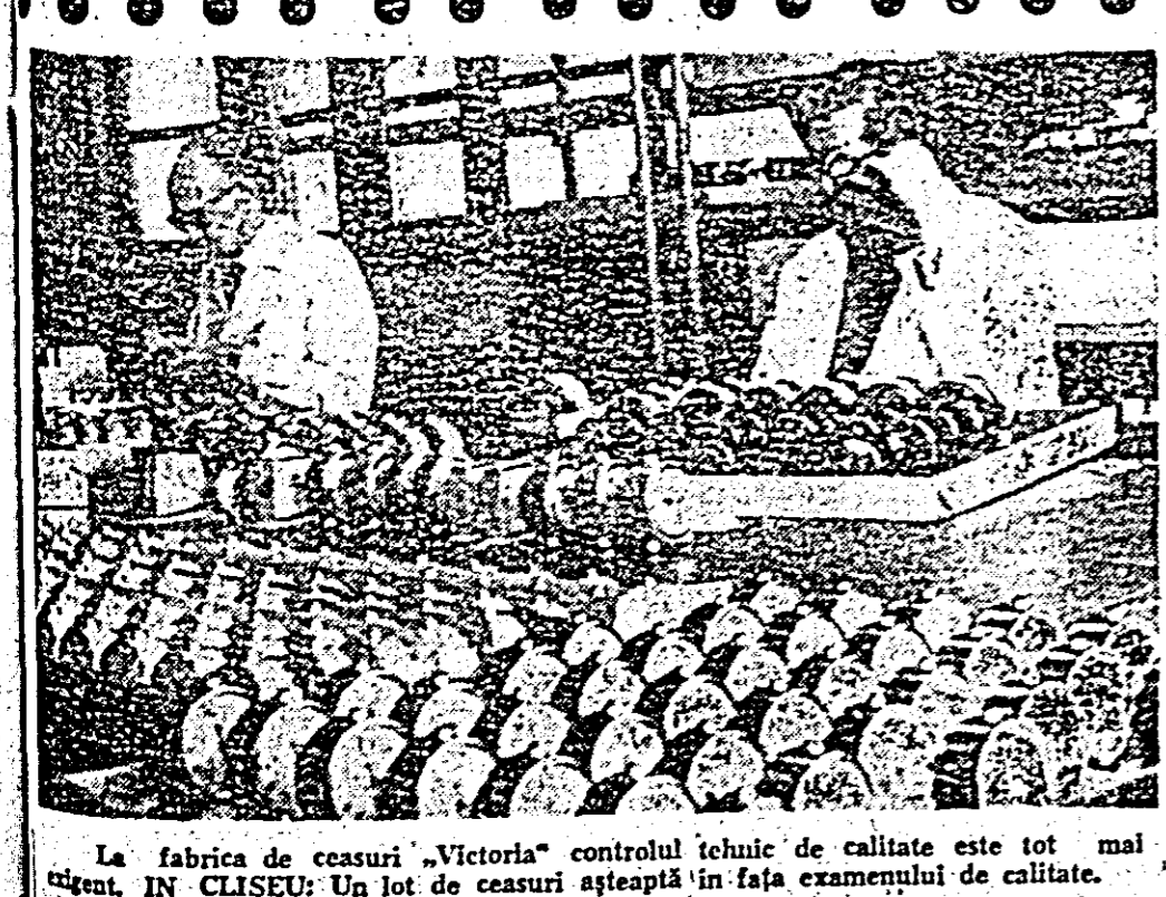
La fabrica de ceasuri „Victoria” controlul tehnic de calitate este tot mai exigent, ÎN CLISEU: Un lot de ceasuri așteaptă în fața examenului de calitate.

NICOLAE CEAUȘESCU Secretar general al Comitetului Central al Partidului Comunist Român Președintele Consiliului de Stat al Republicii Socialiste România ION GHEORGHE MAURER Președintele Consiliului de Miniștri al Republicii Socialiste România