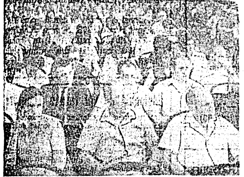
Aspect din timpul constatărilor cadrelor didactice.

În urma și vizită, dezvoltarea gândirii științifice și social-politice, ajutîndu-l să înțeleagă realitățile sociale. În continuare, referatul a menționat rezultatele obținute pe linia educativă patriotică a elevilor, a cultivării responsabilității lor sociale și preocupările unor profesori pentru