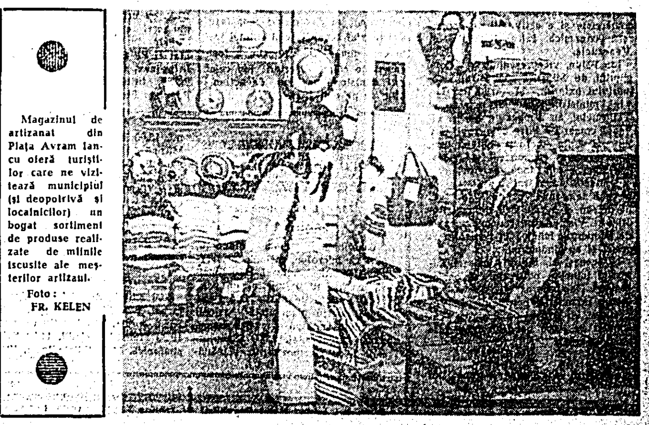
Magazinul de artizanat din Piața Avram Iancu oferă turșitor care ne vizitează municipiul (și depozitivă și localnicilor) un bogat sortiment de produse realizate de minile iscusite ale meșterilor artiștilor.