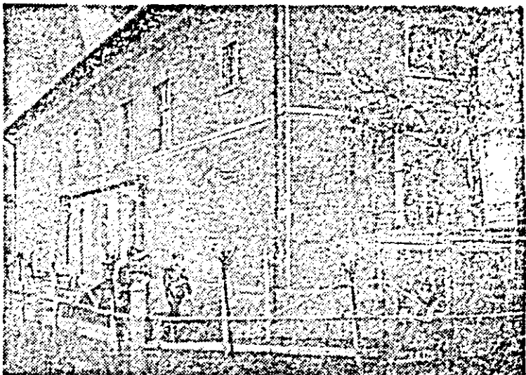
Frumoasă clădire a căminului cultural din Olari.

unde se analizează cu totul alte probleme: dech voiam eu să discut cu dînsul. Și nu știu ce mă face să cred că Gheorghe Borod ascunde și o fire de poet. Așa cum pare a se ascunde aici, în fiecare casă, înăuntrul îmbelșugării satului ce poartă numele unui meșteșug al pămîntului, o boacăne sultătească a unui ethos popular plin