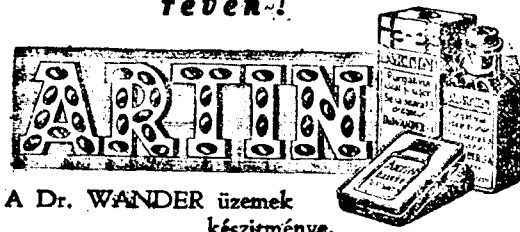
A Dr. WANDER üzemek készítménye.