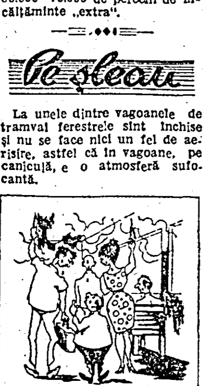
— Nu vă supărați, sîntem în tramvai sau într-o bașcă de a-buri?

Pe steau La unele dintre vagoanele de tramvai ferestrele sînt închise și nu se face nici un fel de aerisire, astfel că în vagoane, pe canăcuță, e o atmosferă sulfocantă.