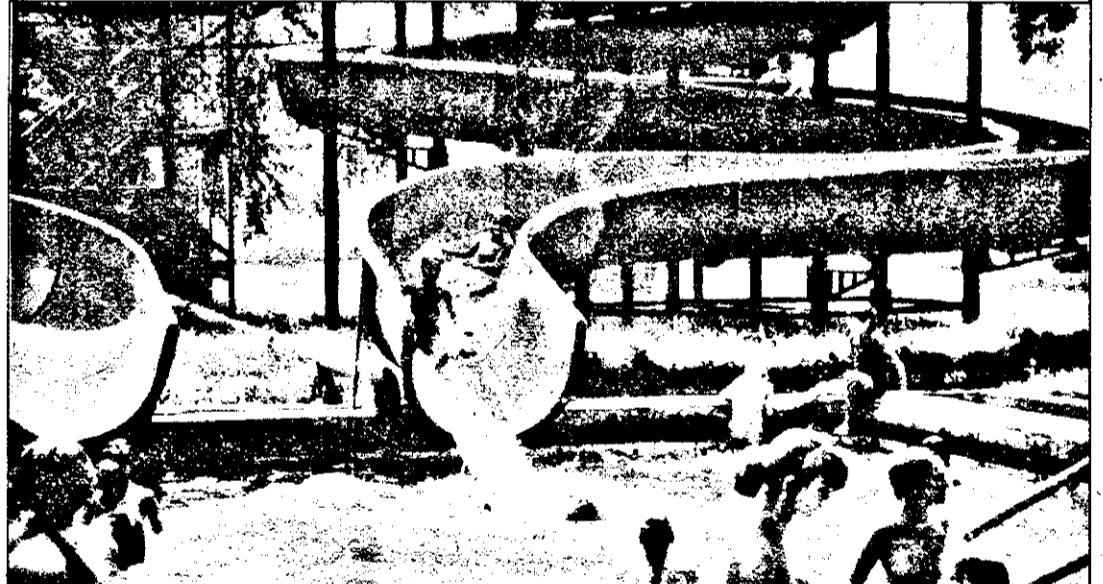
Toboganul acvatic, o mare bucurie pentru cei mici în aceste caniculare zile de sfârșit de iulie