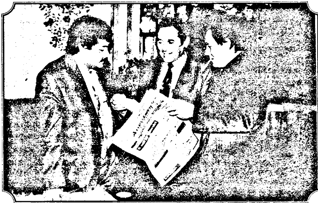
Cotidianul „Adevărul” rămâne, în continuare, cel mai citit ziar.

G. Adams: Sunt conștient de acest lucru. Știu că de vreme ce ai aruncat mingea, adversarii tăi nu vor pregea să ți-o arunce înapoi. Deci, mingea este în posesia noastră și avem de gând să alergăm cu ea.