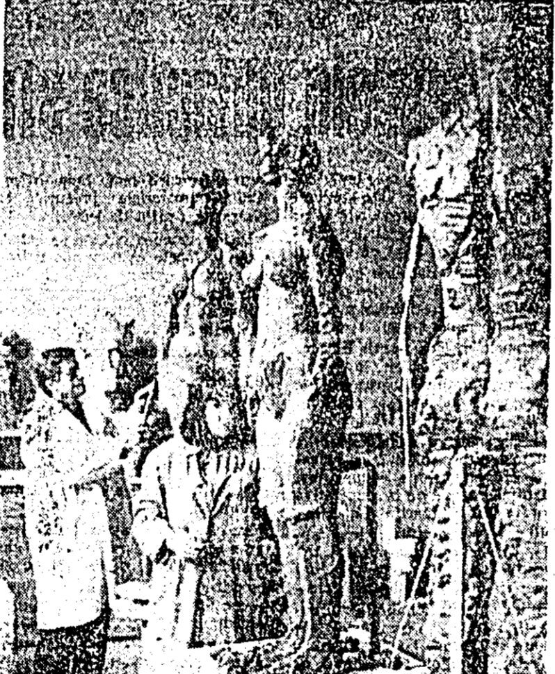
Institutul de arte plastice „N. Grigorescu” din București. Cîrîngele tot mai mari de obiecte uzuale și artă care să corespundă celor mai exigente pretenții, să contribuie la largirea bunei gust al maselor impun o atenție deosebită în pregătirea cadrelor de artiști creatori. În cadrul Institutului de arte plastice din Capitală se formează noi generații de artiști sub îndrumarea celor mai buni maștri în pictură, sculptură, grafică precum și alte arte.