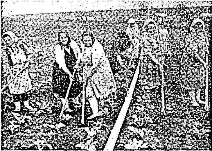
Prașila culturii de conopidă la C.A.P. Felnac.