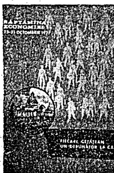
un premiu are valoarea de 100 lei. Tot teri s-a desfășurat la Casa pionierilor un concurs „Cine știe cîștiga” pe tema economiei. Cîștigătorii au fost răspășiți cu frumoase premii individuale.

Teri după-amiază, la Casa pionierilor, a avut loc tragera la sorți a cîștigurilor atribuite de CEC la concursul rebușistic inițiat pe orarele școlare. Cu această ocazie au fost atribuite 10 premii în libret de economii și cecuri de economii școlare cu depuneri inițiale de 50 lei fiecare, astfel că