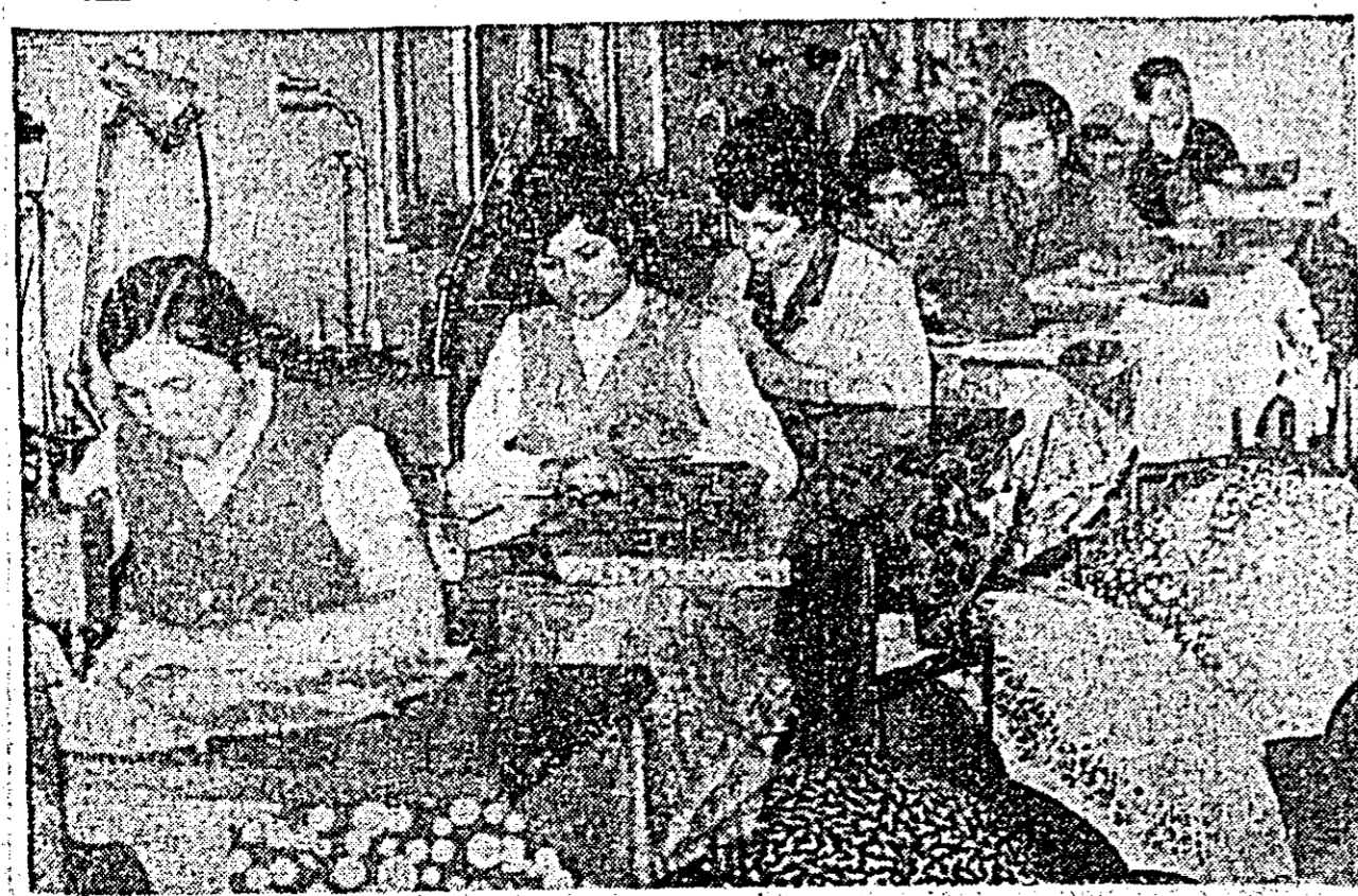
Multicolorele umbrele, care ne incintă privirile și ne apără de capriciile toamnei, sînt produse în această secție de la Întreprinderea Electrometal.

Azi, 27 octombrie a.c. la ora 16.30, vor fi prezentați în sala de festivități a Consiliului popular municipal, propagandiștii de la toate formele învățămîntului de partid din municipiul Arad.