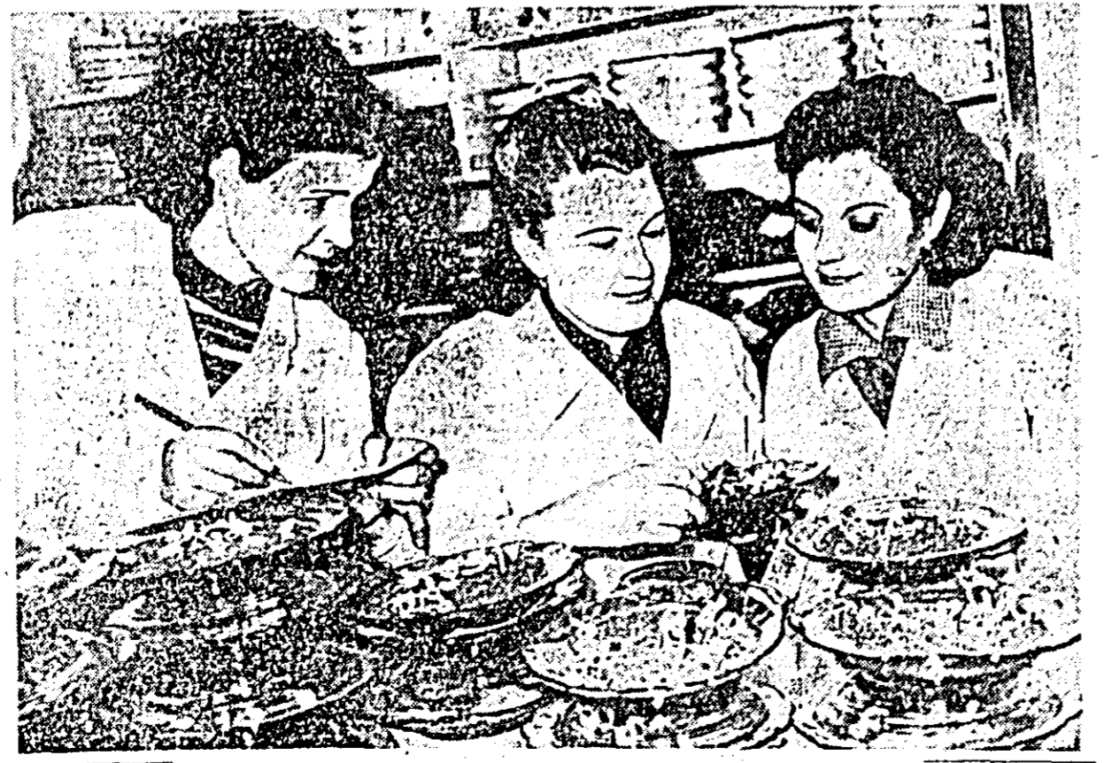
Controlul sîmînțelor de porumb este o problemă de mare însemnătate, întrucît numai sîmînțele sănătoase, cu mare putere de înțepînere pot da recolta bogată. Cliseul nostru prezintă un aspect de la Laboratorul de analiză și controlul sîmînțelor din Arad. Aceste trei tovarășe constată facultatea germinativă a sîmînțelor de porumb.