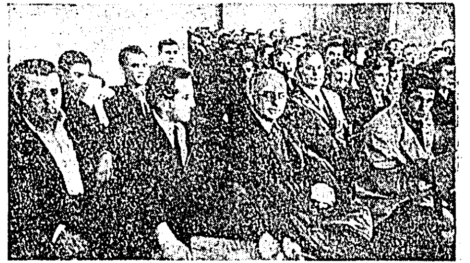
Un aspect din timpul ședinței pentru decernarea diplomelor de onoare.