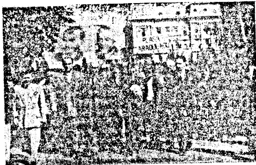
Ministrul poporului în mijlocul re prezentanților autorităților locale

— Faptul că am putut ajunge la definitivarea reformei agrare și în județul nostru, faptul că am putut elimina multe greșeli, se datorește în primul rând griji permanente a primului deputat de Arad, d. ministru Lucrețiu Pătrășcanu (Trăiască!) care ne-a acordat un sprijin total ca să putem desăvârși această reformă, precum și sprijinul permanent de care ne-am bucurat din partea d-lui ministru Traian Săvulescu. (Trăiască!) Pentru acest sprijin și interes, ne exprimăm aici mulțumirile noastre. La fel mulțumim d-lui consilier Măzărceanu pentru îndrumările date, precum și aleșilor poporului, deputaților de Arad, a organizației Blocului Partidelor Democratice și tuturor acelorora care au colaborat la lucrările reformei agrare.